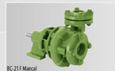
BC-21 F Mancal